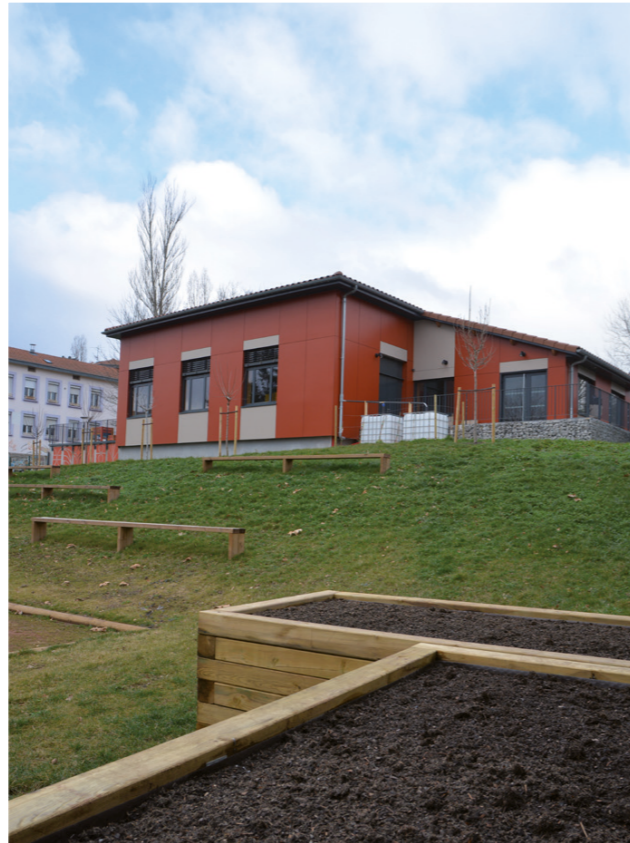
+ Arrière de la Résidence, vue du Pôle Jeunes.